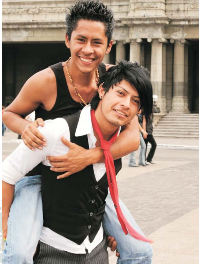
La Campaña Nacional contra la Homofobia de REDHUMOS

Realmente se desconoce el origen de las diferentes manifestaciones amorosas y sexuales. Actualmente los estudios que han investigado sobre el origen de la diversidad sexual no han encontrado diferencias hormonales ni genéticas ni hereditarias que expliquen la diversidad. Algunas teorías han señalado factores psicológicos y culturales que pueden influir.