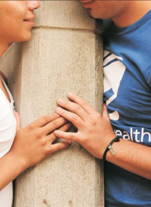
La Campaña Nacional contra la Homofobia de REDNADOS